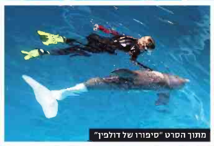
מתוך הסרט "סיפורו של דולפין"