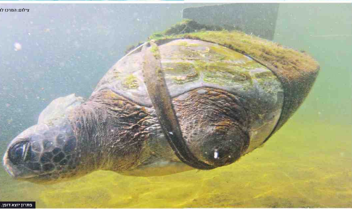
פתרון יוצא דופן. הצב "חופש" שוחה בעזרת הפרוטזה

מאכיל אותם, וברגע שראיתי שיש כזה מקום שמטפל בצבי ים זה קרץ לי נורא.