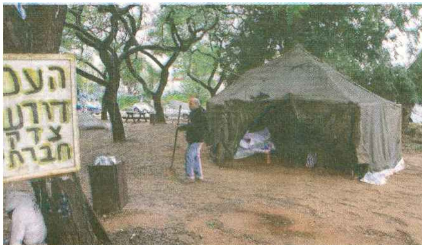
"לא היה שורד לולא המחאה החברתית". מאהל ארלוזורוב