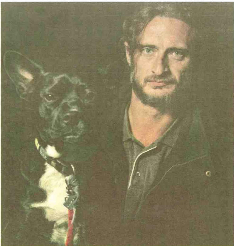
▲ "צולמו באופן שניתק אותם מחיי היומיום במאהל" דיירי מאהל ארלחזרוב, מתוך "עדות מקומית" 2014