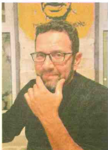
▲ "לעולם לא אצלם אנשים במצב שעלול להביך אותם" חיימוביץ

הם תוצאה עקיפה של המחאה. לולא המחאה של 2011 אין סיכוי שמאהל כמו מאהל ארלחזרוב היה שורר או שהאנשים בו והפעילים המסייעים להם היו מעזים לקום נגד החלטות של עיריית תל אביב לפנות אותם, לעתור לבית המשפט וגם להשיג דחייה בפני נוי ושיתוף פעולה מצד העירייה. "היום כשקורה משהו, פעילי מחאה מעלים סטטוס, משתפים, משהו מתחיל לזוז, עמותות וארגונים מתחברים. לפני המחאה לא היו אנרגיות כאלו. לא הפסדנו את המלחמה, אנחנו בדרך לנצח אותה".