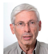
"הליכוד" בני בגין

שאלות פתוחות של סטודנטים בקהל למשתתפי הפאנל