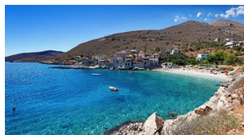
חצי האי פלופונס