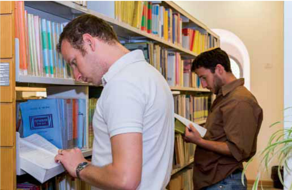
סטודנטים במכללת הדסה