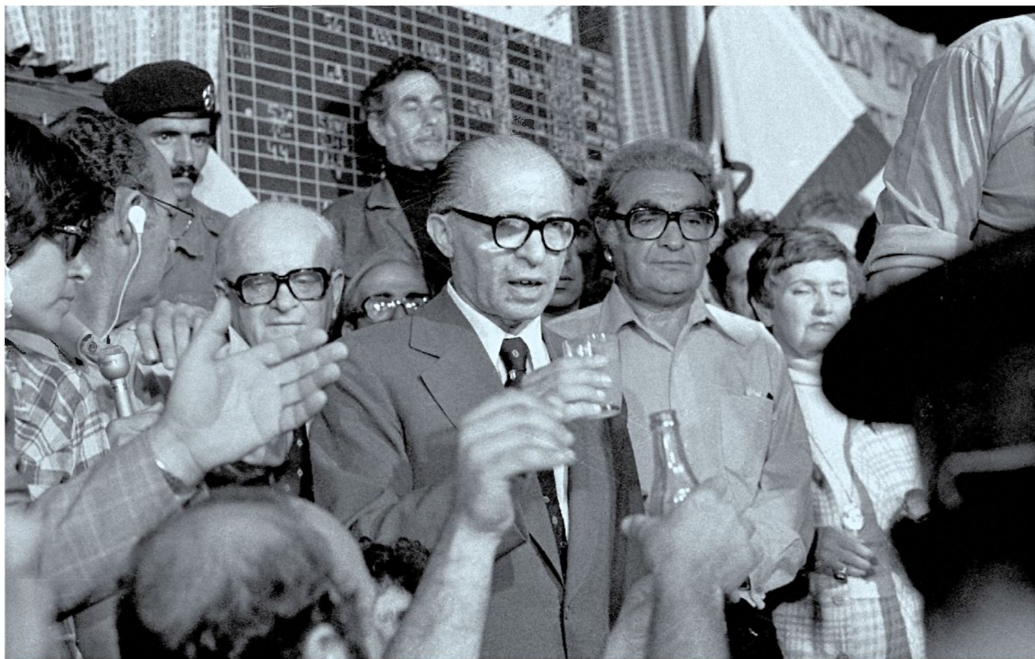
ליל המהפך. "האזרחים הוכיחו שאינם עבדים נפחדים למערך", הכריז בגין. "היום חל מפנה בתולדות העם היהודי ובתולדותיה של התנועה הציונית"

היהלומים. היו שם כל מיני אנשי עסקים, ואחד מהם אמר לו: 'אתה הרי נגד קשרים עם גרמניה, מה תעשה אם שר החוץ הגרמני ירצה לבוא אליך?' בגין ענה: 'אנהג כראש ממשלה'. כבר בתשובה הממלכתית הזאת הוא התחיל להתנהג כראש ממשלה. אפשר לומר שהי ניצחון בבחירות היה באוויר."