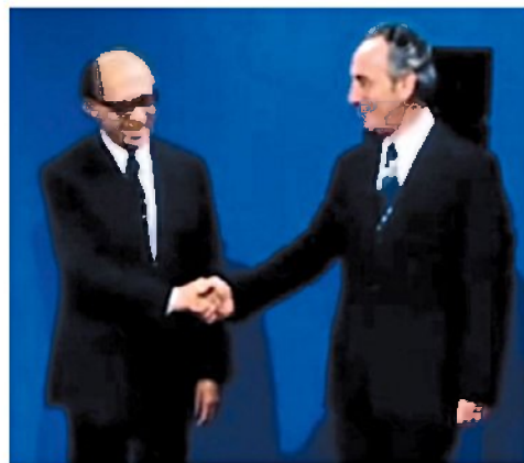
בעימות עם פרס. בגין הזיע מפנסי התאורה

"המערך שיחק על זה, ושמעון פרס שאל כל הזמן, 'איפה מר בגין? מדוע הוא לא מופיע?'. היתה גם בדיחה באותו זמן, שראשי התיבות מח"ל הן מנחם חולה לב."