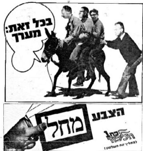
לצחוק על היריב. מודעת בחירות של מחל

"בגין עצמו הגיע מאוחר בלילה, אחרי שהניצחון היה בטוח. את נאום הניצחון הוא נשא כמעט בשלוש לפנות בוקר, אחרי שידענו את תוצאות האמת. הוא עמד על הבמה עם הפעילים ועם האנשים שנבחרו לרשימה, כמו יגאל הורביץ, שהיה אחר כך שר המסחר והתעשייה שהתחיל בדרכו הפוליטית במפלגת רפ"י