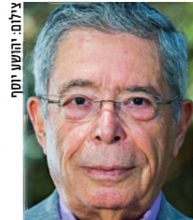
נאור: "דיבר כמו מנהיג"