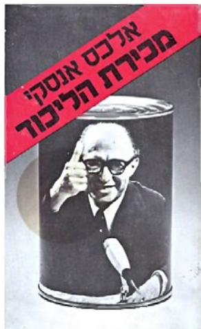
עטיפת הספר שכתב אלכס אנסקי לאחר הבחירות, בהשראת ספר שחבר בארה"ב