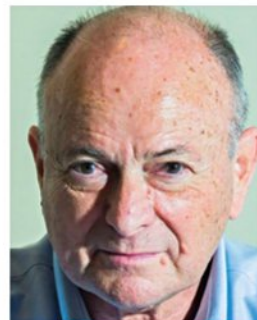
מילוא. "ידיי רעדו כשדיברתי"

כמה שעות קודם לכן, קצת אחרי השעה 23:00, הופיע חיים יבין על המרקע עם תוצאות מדרגם הטל' ווייזה ואמר לעם ישראל את המילה "מהפך" - מילה שנחרתה בתודעה ושינתה את ההיסטוריה. בפעם הראשונה מאז הקמתה, הפסידה מפא"י (שהפכה למערך) את השלטון. הליכוד זכה לאמון העם ועלה מ־39 ל־43