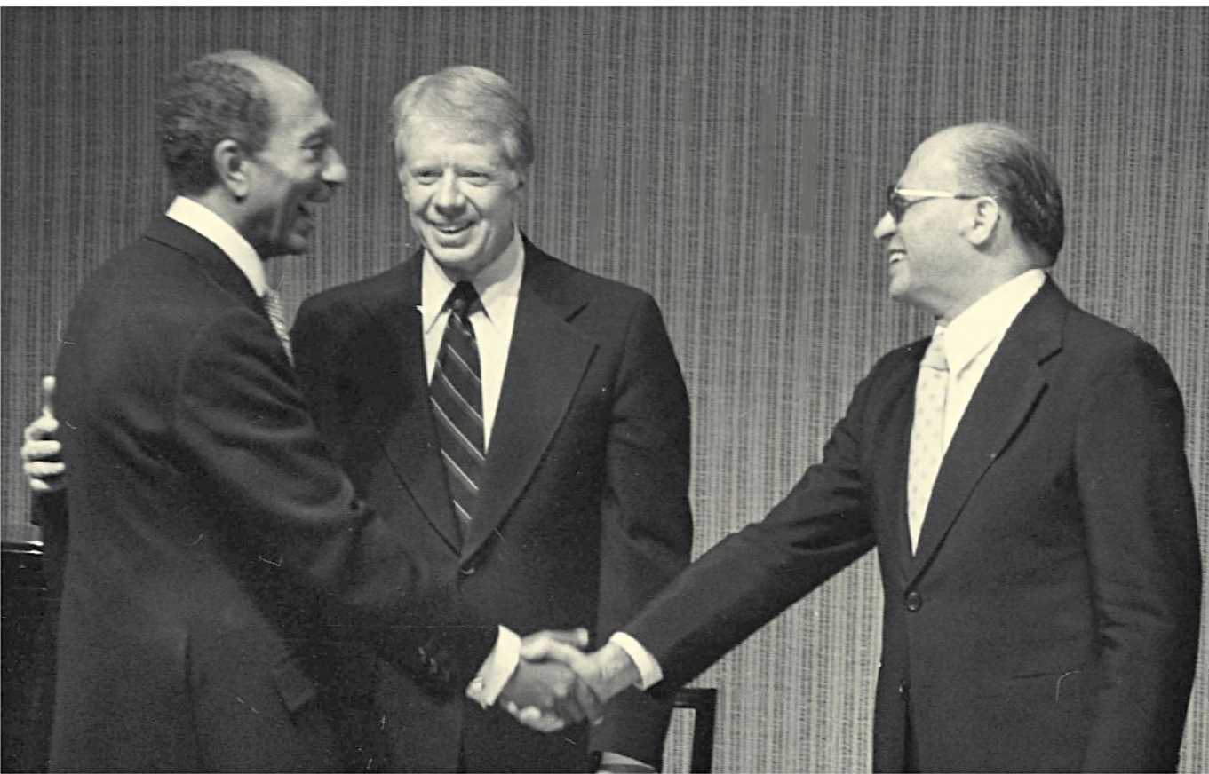
בגין, קרטר וסאדאת בחתימת הסכם השלום עם מצרים, 1979. "הפיוס עם מצרים היה מטרה אסטרטגית מבחינת בגין", אומר אריה נאור

משה ניסים: "אחרי הבחירות היו אופוריה ושמחה גדולה. הרי נפל דבר שלא קרה בעבר ולא כולם ציפו לכך. גם הנפילה של המערך ל-32 מנדטים תרמה לתחושת ההתעלות, כי זה לא רק שאנחנו ניצחנו, אלא שהם נפלו נפילה דרסטית"