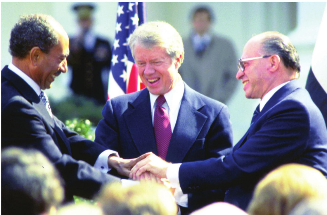
ד"ר בגין ומיסטר מנחם. חותם על הסכם קמפ דייוויד עם סאדאת וקרטר, מבקר במוצב בופור הכבוש עם שרון

כזב, או ביתר דיוק יצורה חוגים מסוימים שאולי הם קרו- בים יותר אליך, כי איש מלחמה הנני וטבעי הוא זה של שואף דמים", השיב בגין לעוז, "כל ימי שנאתי מלחמות והנשיאה באחריות לחיי אדם הייתה הקשה בניסיונותי. הואל נא לרשום לפניך, אדם הלוחם לחירות עמו יכול להיות שהינו איש שלום".