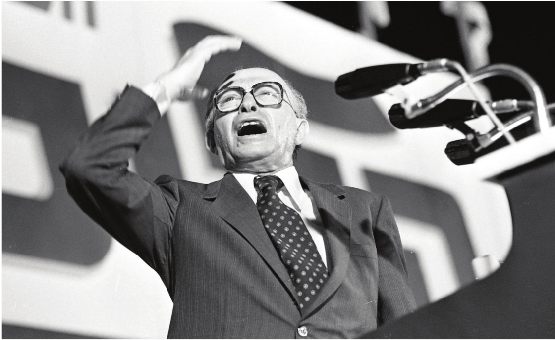
נאום כיכרות בדרך לניצחון (למעלה), תוגת התבוסה של פרס (למטה משמאל), מלחמת הכרזות של המפלגות הגדולות לפני המהפך (למטה מימין)