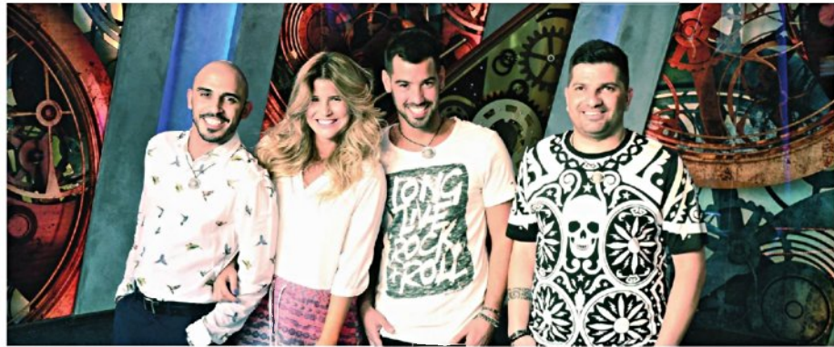
מצלמות בכל מקום. "האח הגדול" ו"רוקדים עם כוכבים"