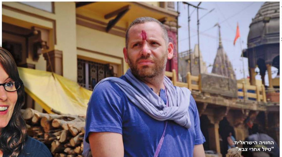
החוויה הישראלית. "טיול אחרי צבא"