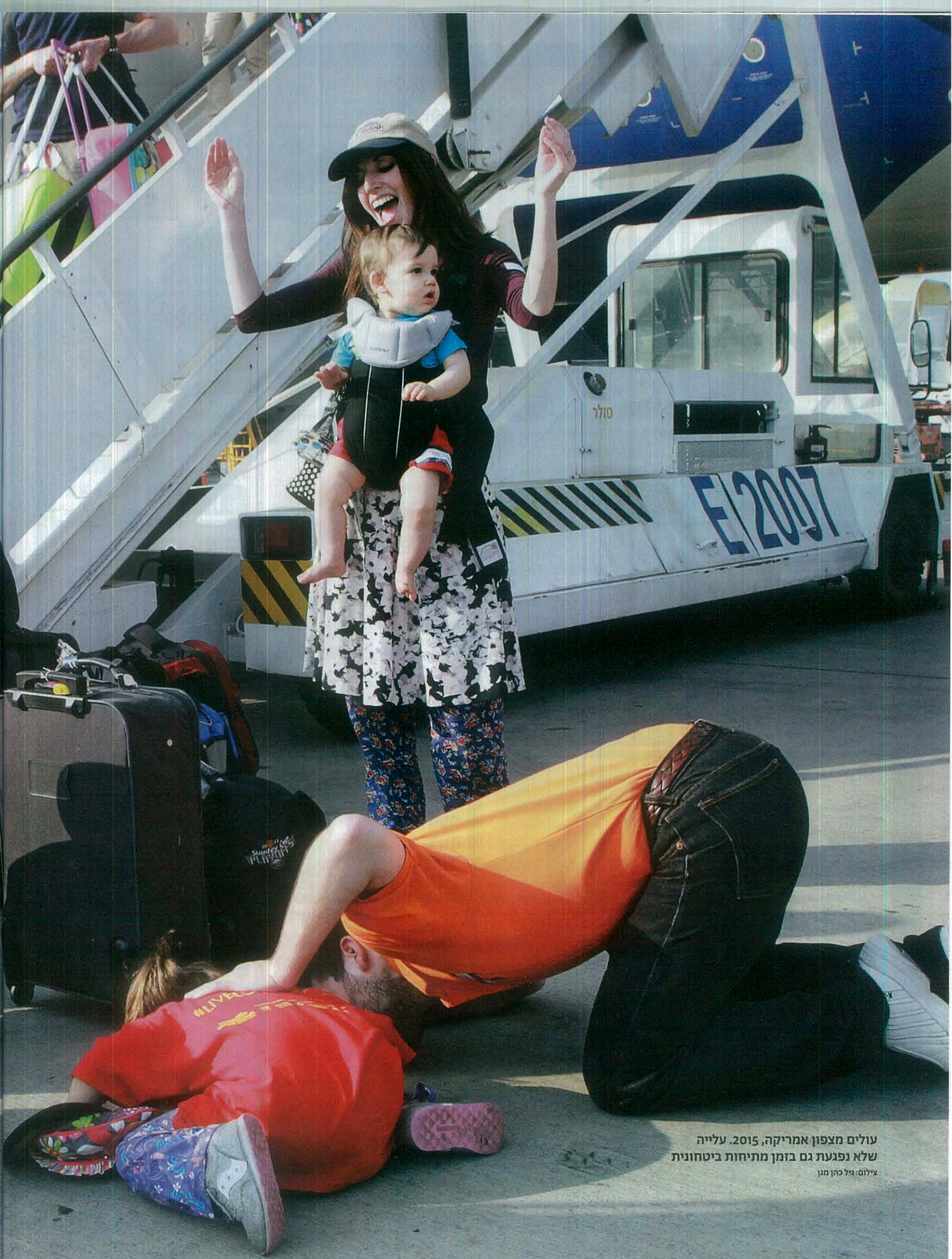
עולים מצפון אמריקה, 2015. עלייה שלא נפגעת גם בזמן מתיחות ביטחונית