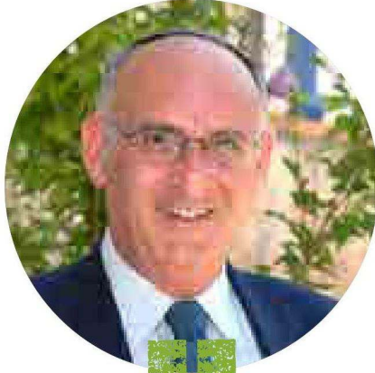
ציולם: יוני לובלינר

פרופ' פרידלנדר: "בראש ובראשונה זה חוסך לסטודנטים את זמני ההגעה לקמפוס ולעיתים מאפשר לסטודנטים שלומדים רחוק מהבית, להישאר לגור עם ההורים ובכך לאפשר להם חיסכון כלכלי משמעותי. הלמידה בזום מאפשרת להשתמש בכלים שאינם קיימים באופן פרונטאלי כדוגמת חלוקה פשוטה ומהירה לקבוצות עבודה ושימוש בכלים אינטראקטיביים שמייצרים השתתפות פעילה של הסטודנטים במהלך השיעור".