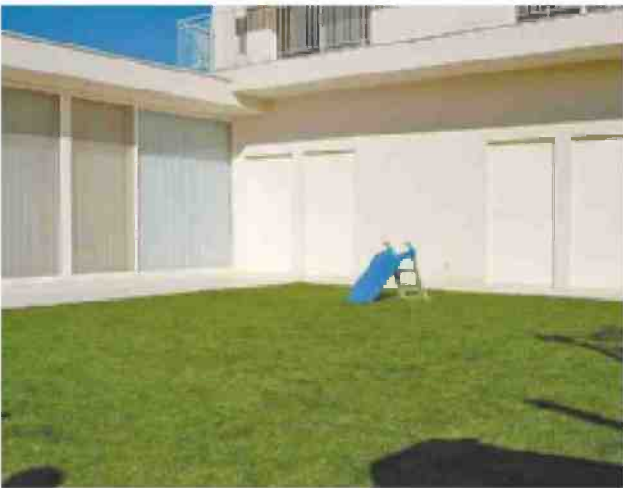
נדיה שובלוב, ללא כותרת, 2013, בית ספר מוסררה