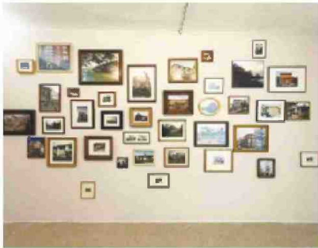
קרן רוזנברג, "הצבת לילה", 2013, בית ספר מוסררה