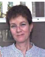
ד"ר כהן

"עד המהפכה בשנת '79 המצב של רוב היהודים באיראן היה טוב. היו להם עבדי דה טובה וחיים טובים. אמא שלי, למשל,