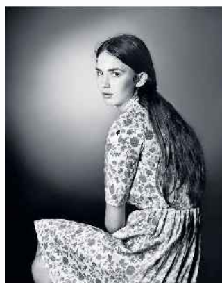
דיומיים מתוך התערוכה. המגבלות שנבעו מזהות המצולמות עיצבו במידה רבה את התוצאה הסופית