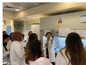
כתבה וצילמה: ד"ר איילת ברנהולץ