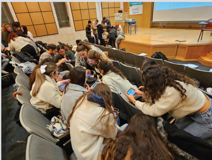
כתבה: ד"ר איילת ארבל-עדן