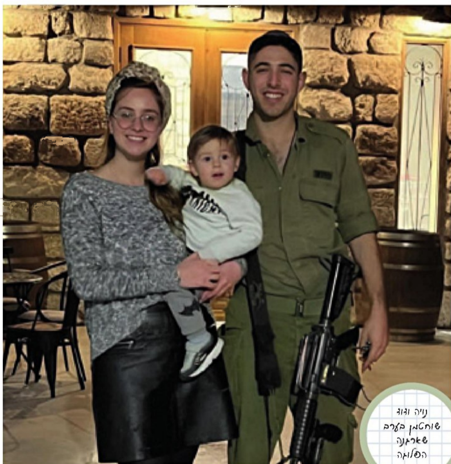
נייה וזוג שוחטמן סערב שארנה הפלומה